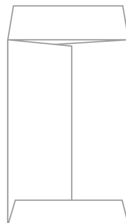
仕上がり裏面イメージ