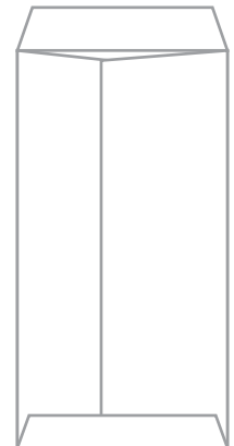
仕上がり裏面イメージ